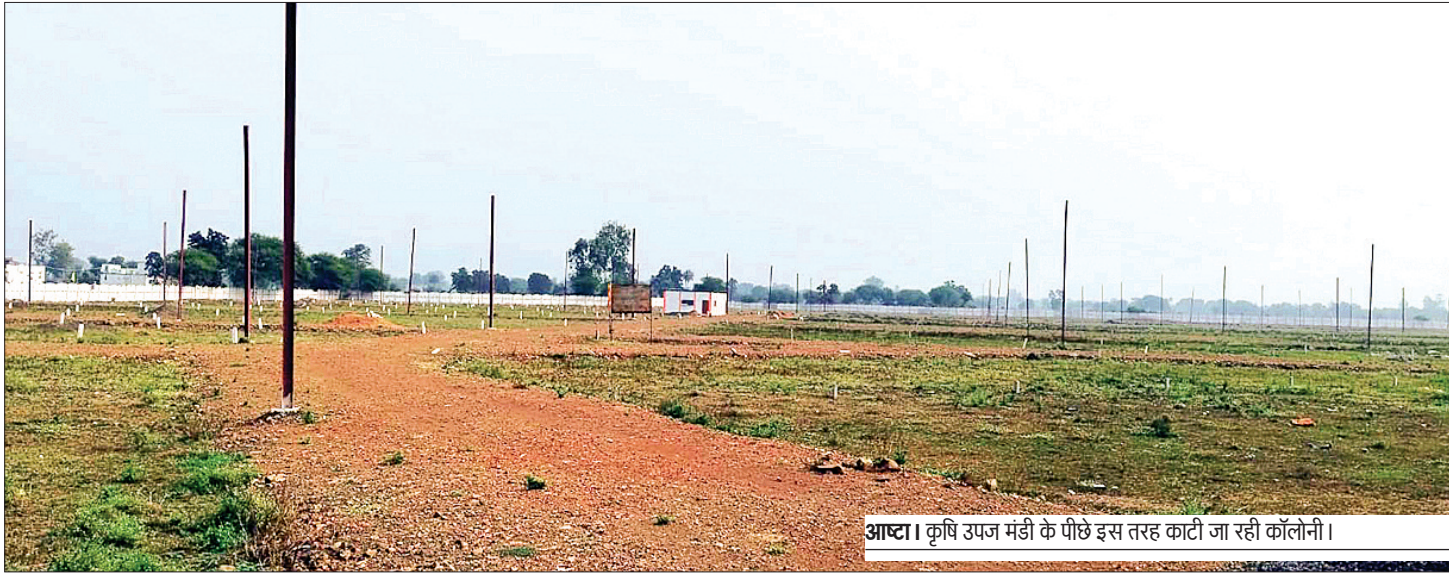
आष्टा। कृषि उपज मंडी के पीछे इस तरह काटी जा रही कॉलोनी।